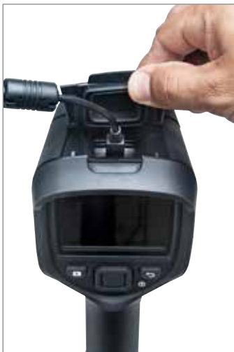
Bilder schnell über USB herunterladen

Änderungen der technischen Daten vorbehalten. Die jeweils neuesten technischen Daten finden Sie auf www.flir.com .