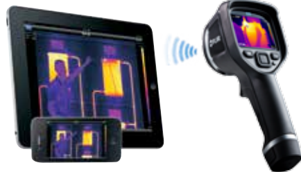
WLAN-Konnektivität für Smartphones, Tablets und mehr

*nach System-Registrierung unter www.flir.com