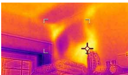
Temperaturmuster zeigen Gebäudemängel wie fehlende Dämmungen an.